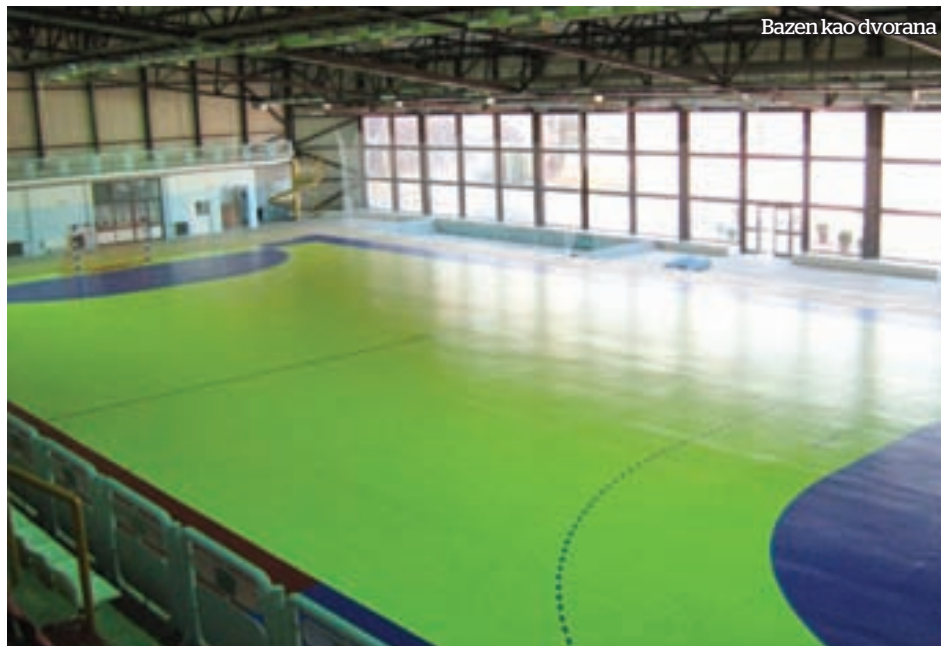
Bazen kao dvorana

- Treba da se otvore bazeni u Nikšiću i Podgorici, a sigurno da ima i drugih planova i želja, ali da govorimo o onome što je trenutno realno. Da se izvrši rekonstrukcija bazena u Nikšiću, a sa druge strane pokrije bazen u Podgorici od 33 metra i da se uz podršku Saveza pokrene rad na tim objektima. Smatram da je to vrlo važno prvo za te gradove, potom za Sa-