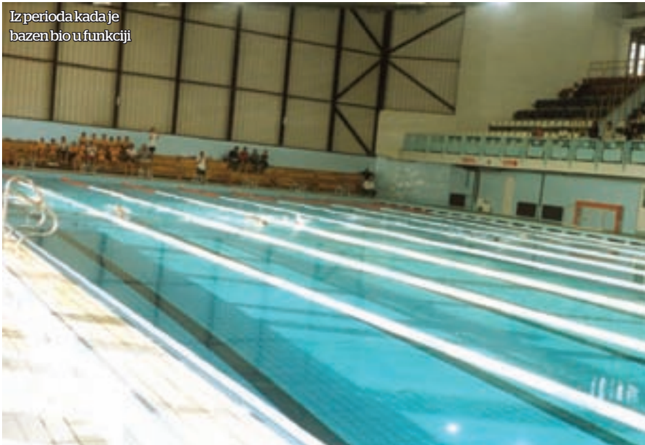
Iz perioda kada je bazen bio u funkciji